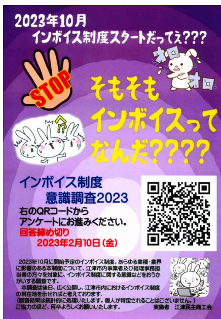
図 江津民商の消費税インボイス制度意識調査の結果から

江津民商では2月中旬、江津市内の事業者と経理担当者を対象に、消費税インボイス（適格請求書）制度に関する意識調査をウェブアンケートで実施（1月20日～2月10日）し、37者から回答を得ました。商工会議所などでもインボイス制度に関する地元業者の実態調査は行われておらず、民商から発信しようと、取り組み、会外には信用金庫、建築組合、シルバー人材センターなどにも協力を依頼。まだまだ「知られていない」「理解されていない」実態が明らかになりました。